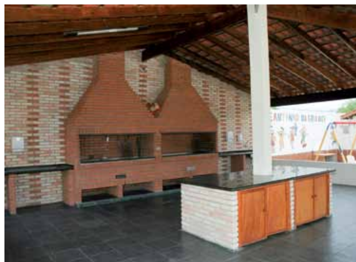
➤ Espaço convidativo para degustar um bom churrasco com os amigos