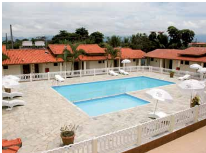
➤ Nossa estrutura oferece o máximo de aconchego e conforto

Mais informações pelo telefone 3259-0411, ramais 224, 230 e 249.