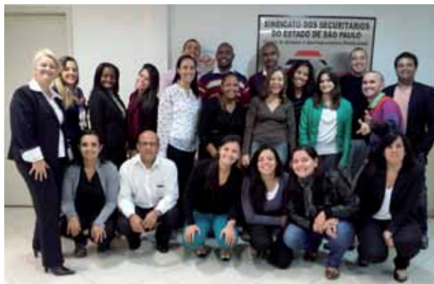
➤ Curso Técnico de Sinistros de Automóvel