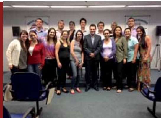
➤ Curso Técnico de Sinistros de Ramos Elementares