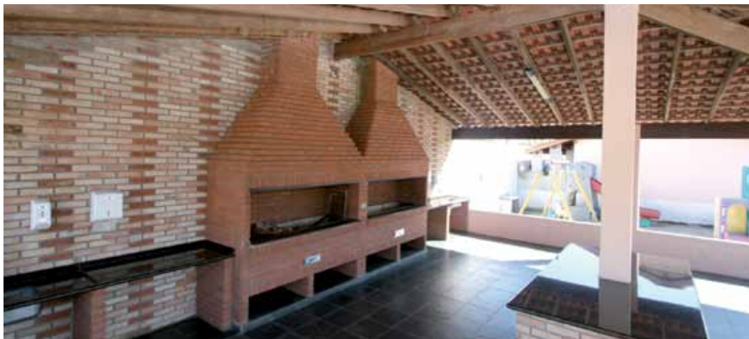
➔ Colônia de Férias em Caraguatatuba