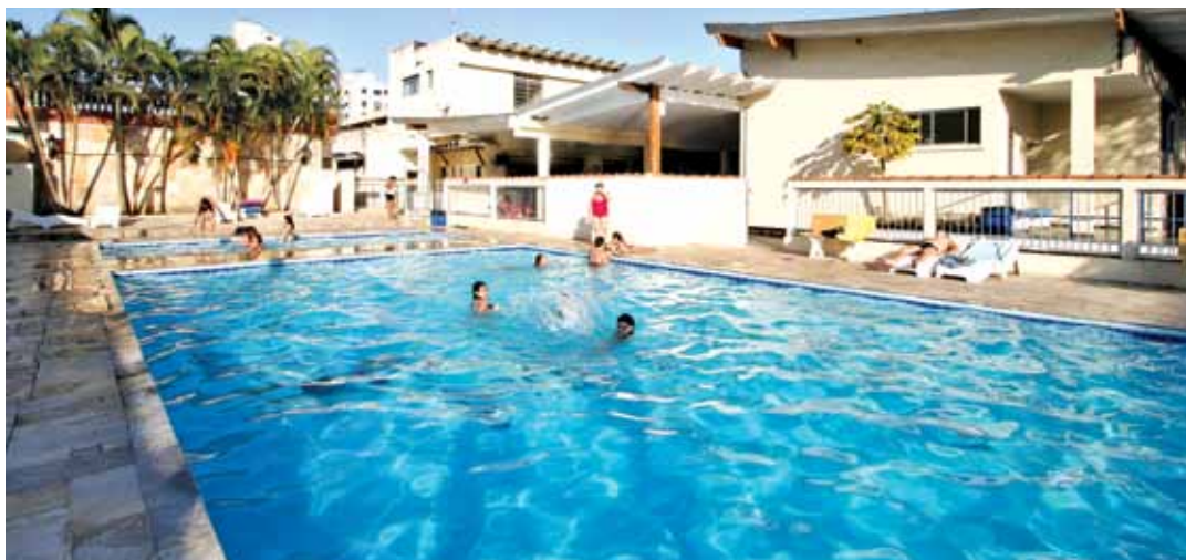
➔ Colônia de Férias em Praia Grande