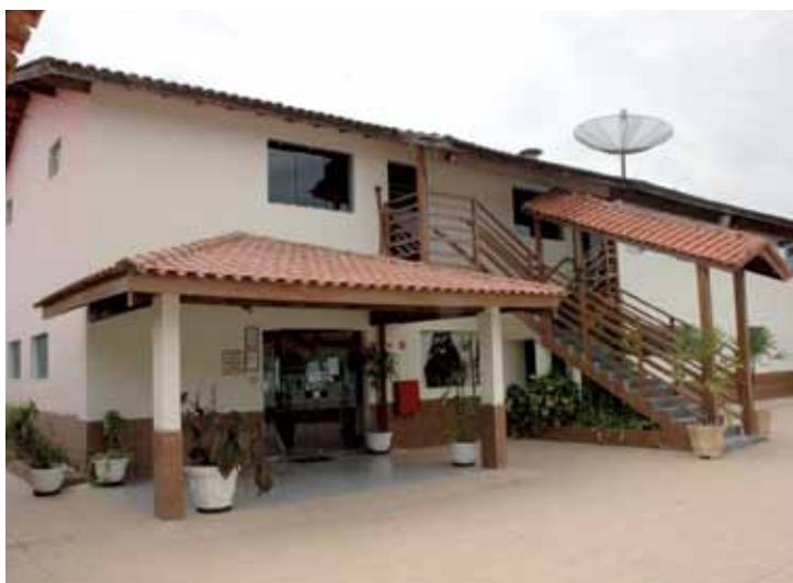
➤ Colônia dos Securitários, a melhor opção de hospedagem em Caraguatatuba