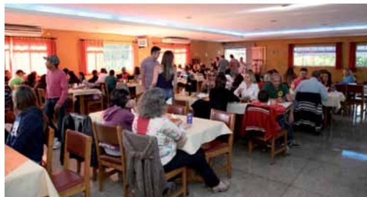
➤ Boa comida e alegria marcaram o almoço do Dia das Mães

No dia 11 de maio, o Sindicato dos Securitários promoveu um almoço festivo em homenagem ao Dia das Mães.