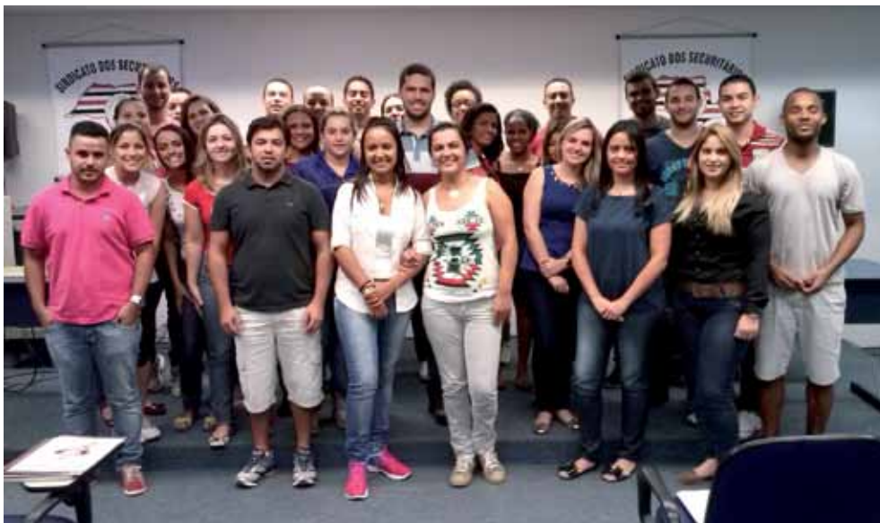
➤ Curso Técnico de Seguros de Transporte

A diretoria do Sindicato dos Securitários parabeniza a todos os que concluíram seus cursos, reafirmando o compromisso de continuar proporcionando à categoria a cursos de qualidade a seus associados, visando oportunizar a caminhada rumo ao crescimento pessoal e profissional.