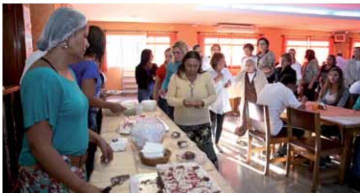
➤ Mães aguardam pelo merecido bolo