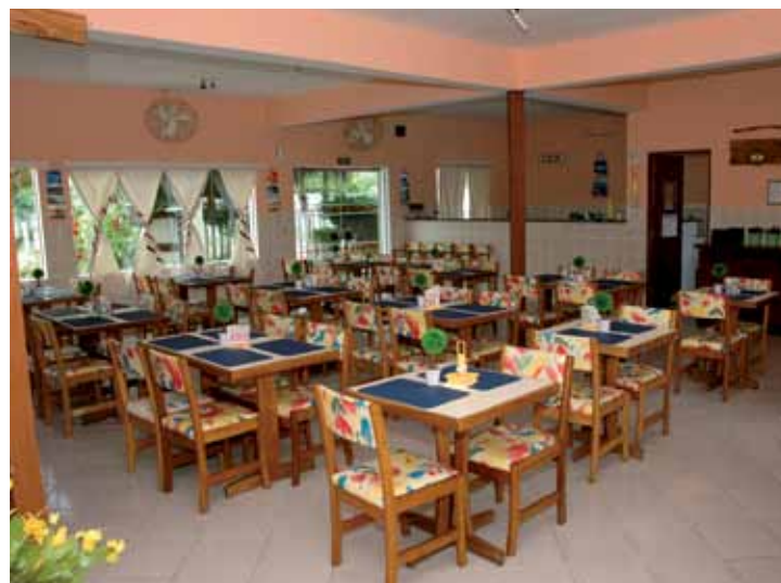
➤ Restaurante com conforto e higiene para sua refeição