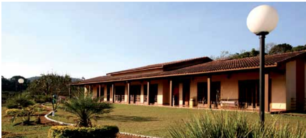
➔ Centro Campestre e Pesqueiro, em Ibiúna

Mais informações pelo telefone (11) 3259-0411, ramais 224,230 e249, das 13:00 as 18:30 horas.