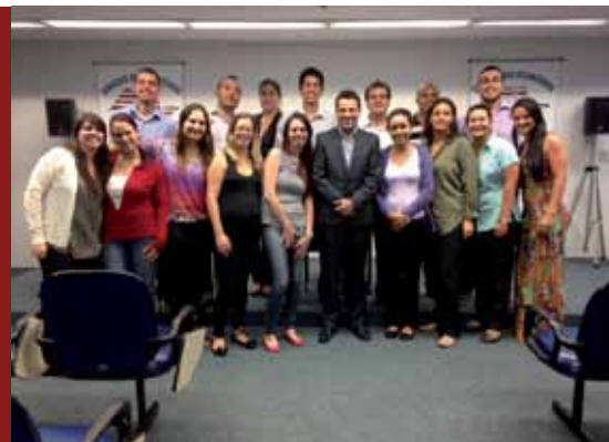
➤ Curso Técnico de Sinistros de Ramos Elementares