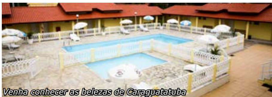
Venha conhecer as belezas de Caraguatatuba