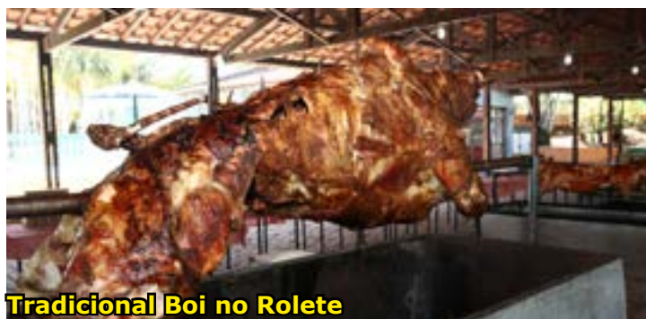
Tradicional Boi no Rolete