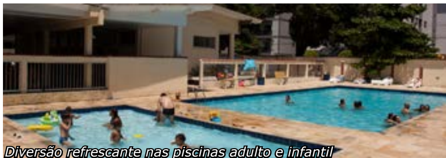
Diversão refrescante nas piscinas adulto e infantil

Informações pelo telefone 3259-0411, ramais 224, 230 e 249, das 9h às 18h30, ou pelos e-mails keroly@securitariosp.org.br e nilza@securitariosp.org.br