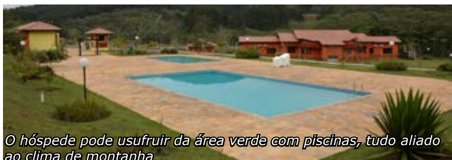
O hóspede pode usufruir da área verde com piscinas, tudo aliado ao clima de montanha