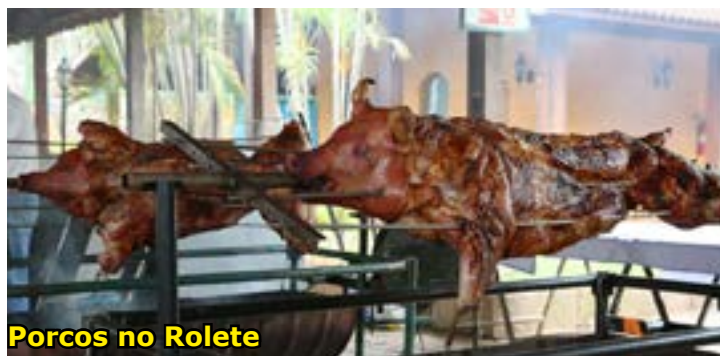
Porcos no Rolete