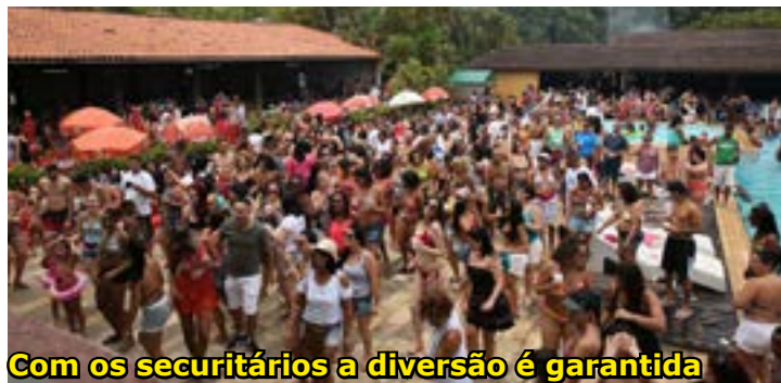
Com os securitários a diversão é garantida

Informações pelo telefone (11) 3259-0411, ramal 228, de segunda a sexta-feira, das 8h30 às 18h30.