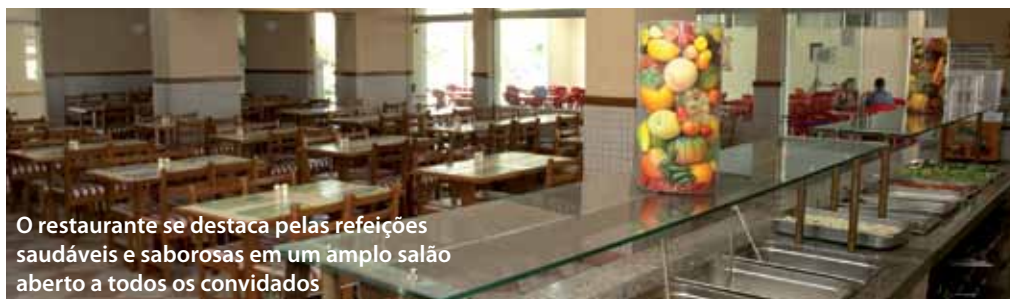
O restaurante se destaca pelas refeições saudáveis e saborosas em um amplo salão aberto a todos os convidados