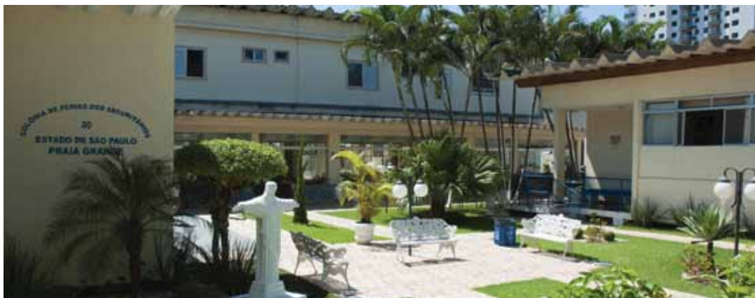
➔ Colônia de Férias em Praia Grande