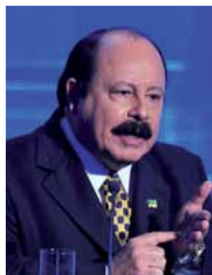
➤ Levy Fidelix (PRTB)