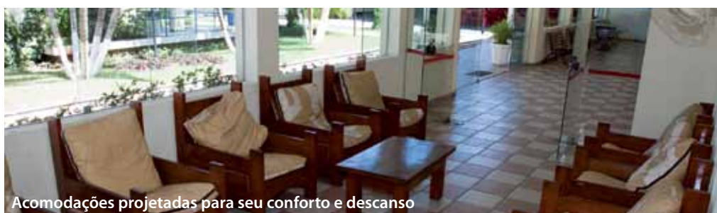
Acomodações projetadas para seu conforto e descanso