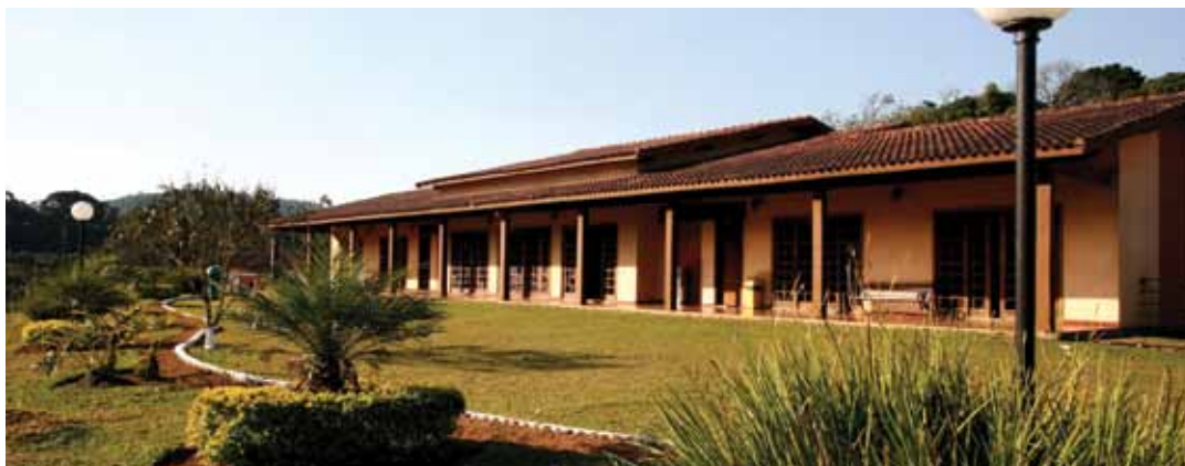
➔ Centro Campestre e Pesqueiro, em Ibiúna