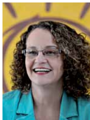
➤ Luciana Genro (PSOL)