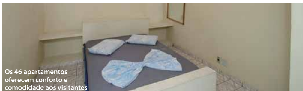
Os 46 apartamentos oferecem conforto e comodidade aos visitantes