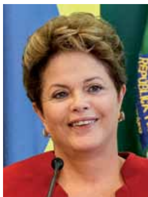
➤ Dilma Rousseff (PT)