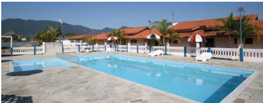
➔ Colônia de Férias em Caraguatatuba