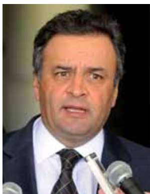
➤ Aécio Neves (PSDB)