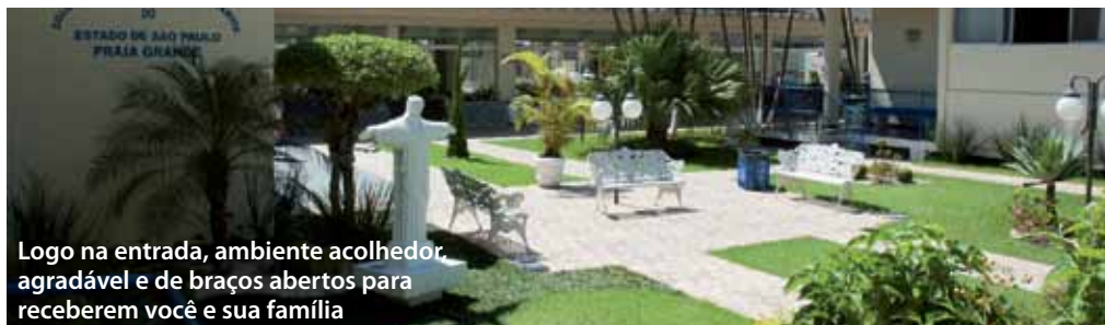
Logo na entrada, ambiente acolhedor agradável e de braços abertos para receberem você e sua família