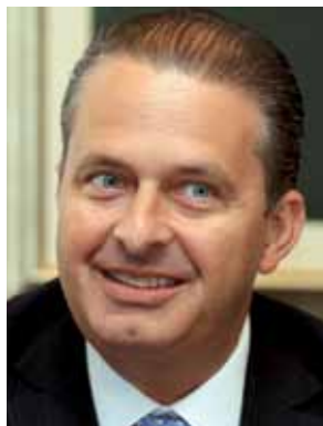
➤ Eduardo Campos (PSB)