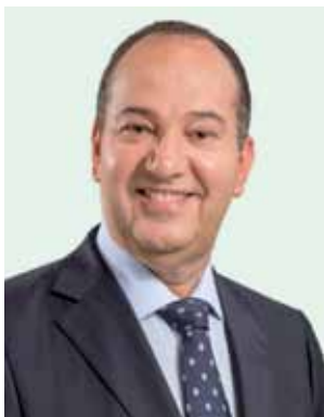
➤ Pastor Everaldo (PSC)