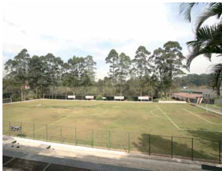
➤ Campo de futebol