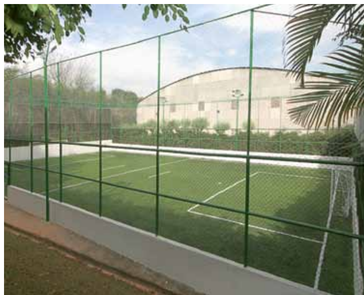
➤ Quadra de futebol society