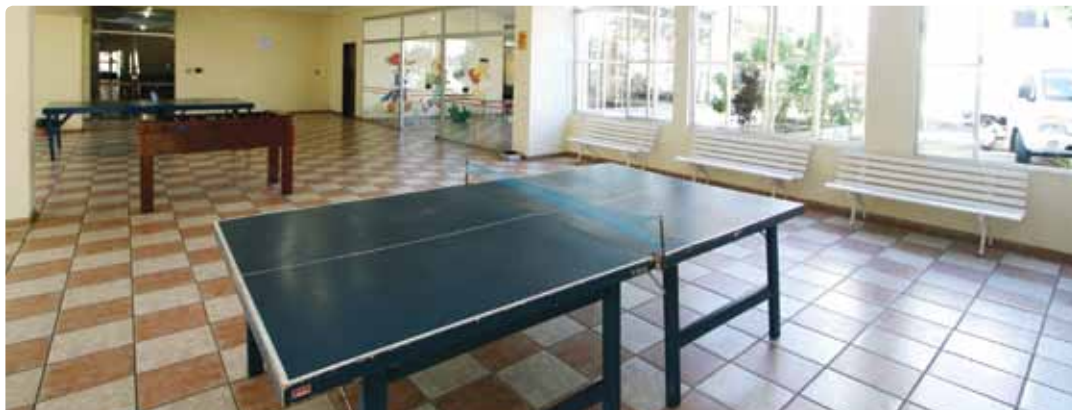
Colônia de Férias de Praia Grande