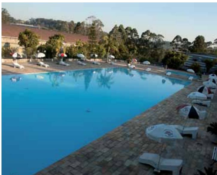
➤ Piscinas adulto e infantil