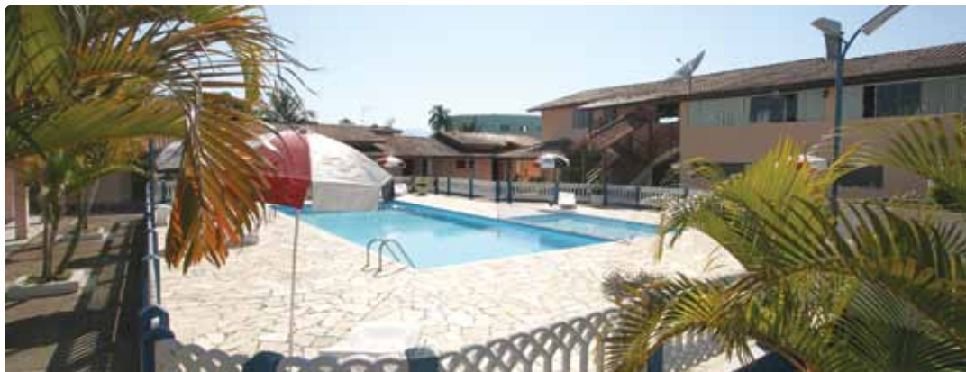
Colônia de Férias de Caraguatatuba