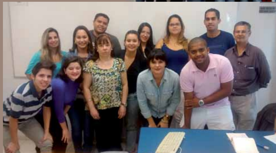
➤ Curso Técnico de Seguro de Automóvel