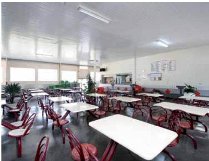
➤ A lanchonete oferece amplo espaço para as refeições

Informações e Reservas Telefone/Fax (11) 2521-0112 / 2521-3341 Visite o site www.securitariosp.org.br