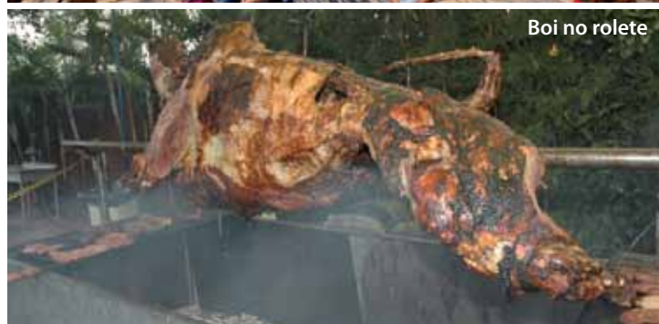
Boi no rolete