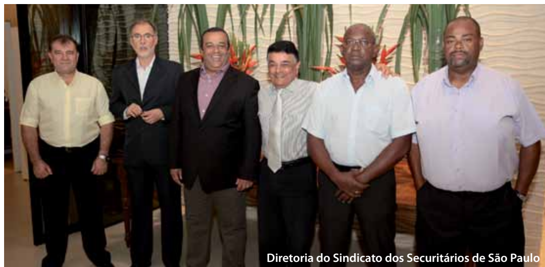
Diretoria do Sindicato dos Securitários de São Paulo