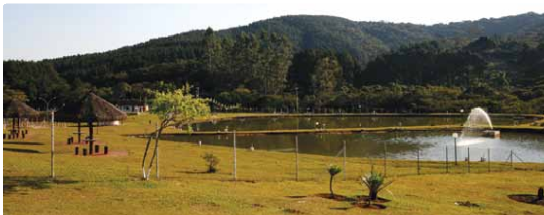
Centro Campestre/Pesqueiro de Ibiúna