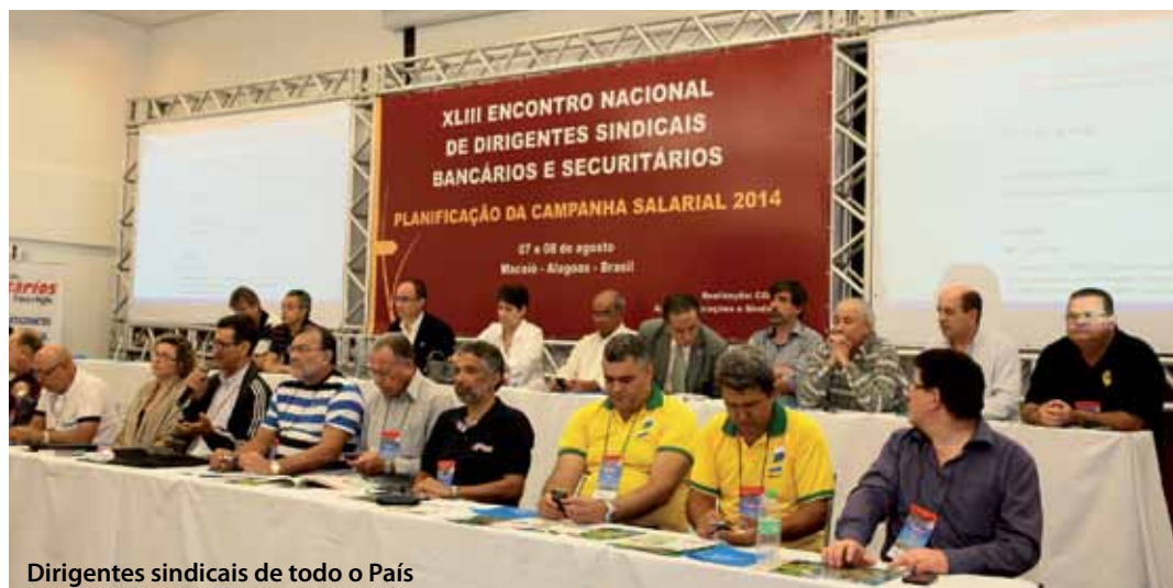
Dirigentes sindicais de todo o País

Durante o encontro, a Diretoria do Sindicato dos Securitários do Estado de São Paulo debateu e analisou as propostas relativas aos principais eixos da campanha salarial deste ano, estratégias de ação, índices de reajuste salarial, entre outros.