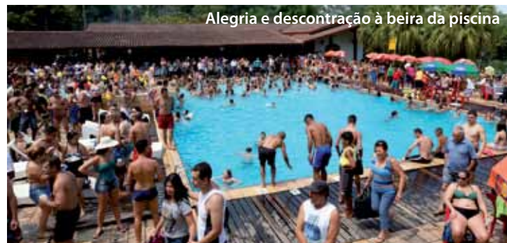
Alegria e descontração à beira da piscina

Informações e reserva de convites pelo telefone (11) 3259-0411, de segunda a sexta-feira, das 8h às 18h30.