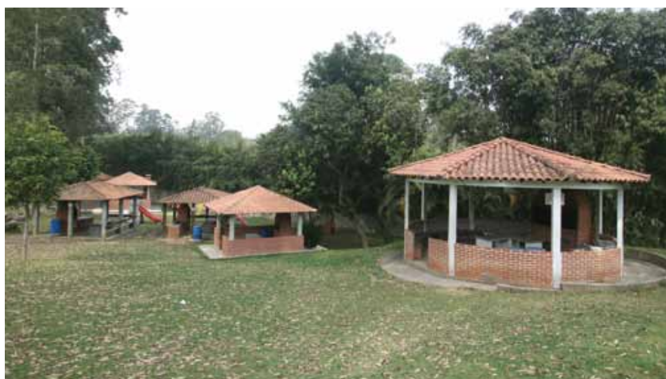
➤ Quiosques equipados com churrasqueira