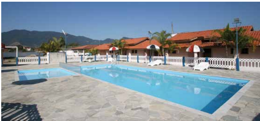
➔ Colônia de Férias em Caraguatatuba