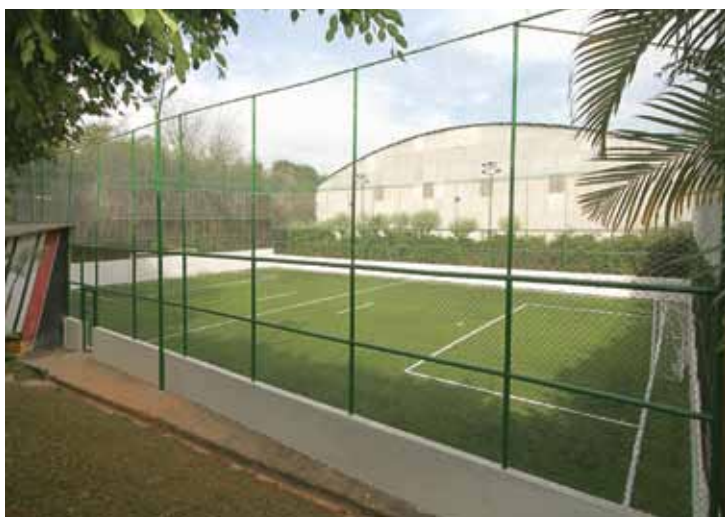
➤ Quadra de futebol society