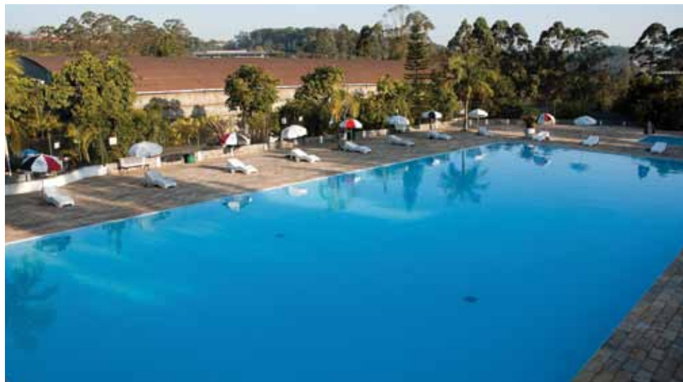
➤ Piscina para o associado e seus dependentes desfrutem momentos de lazer e bem-estar

Visite nosso site www.securitariosp.org.br