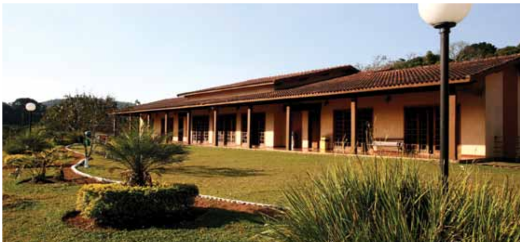
➔ Centro Campestre e Pesqueiro, em Ibiúna

Mais informações pelo telefone (11) 3259-0411, ramais 224,230 e249, das 13:00 as 18:30 horas.