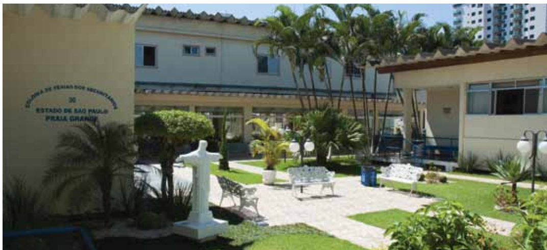
➔ Colônia de Férias em Praia Grande